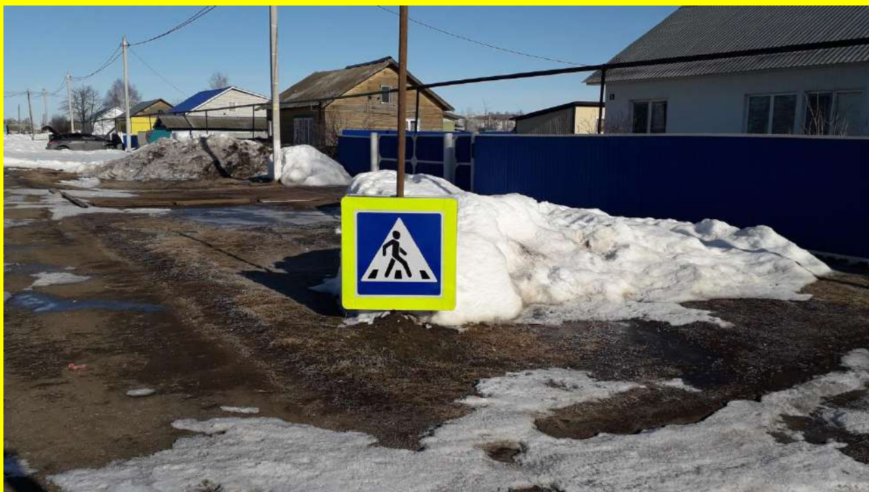
Фото 21. Патрулирование в местах массового передвижения детей и подростков через проезжую часть (профилактика нарушений ПДД детьми и составление карточек «Стоп – твоя жизнь в опасности!», пропагандистская работа с нарушителями).