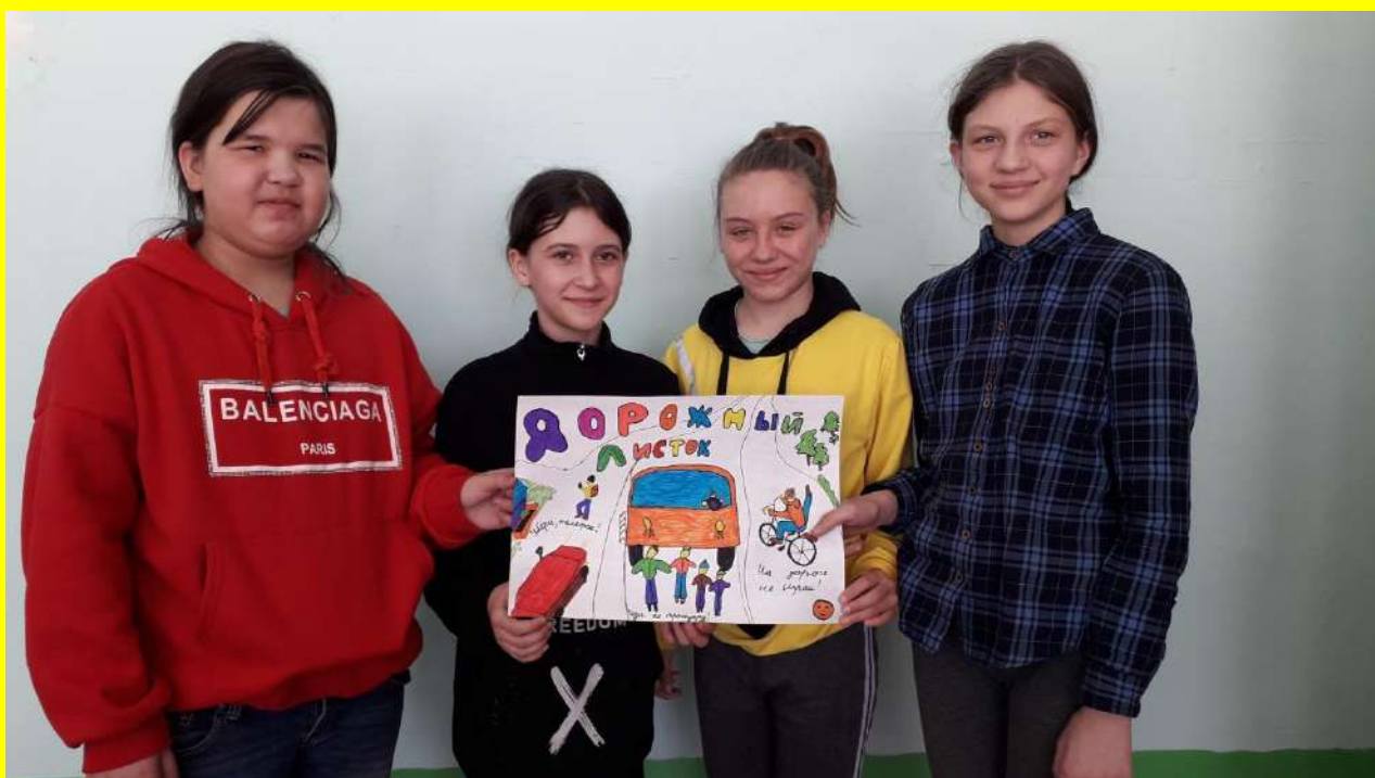
Фото 7. Выпуск листовок по профилактике нарушений ПДД.