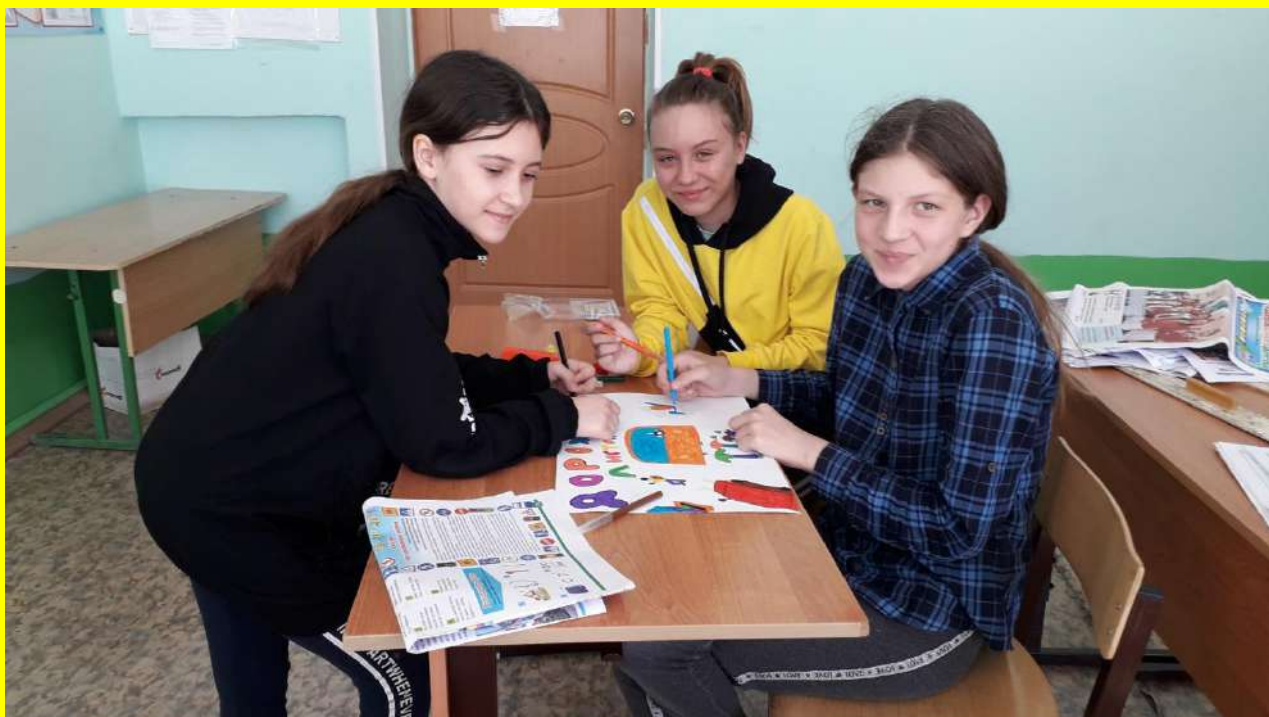
Фото 22. Выпуск листовок по результатам патрулей. Штаб отряда «Глобус».