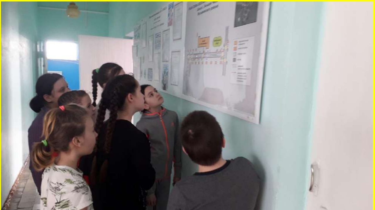
Фото 5. Рассказ о безопасном маршруте при передвижении от дома к школе и обратно.