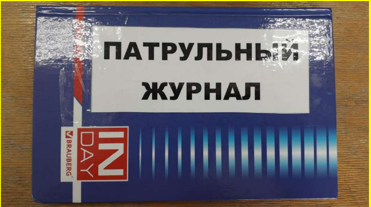
Фото 8. Патрульный журнал.