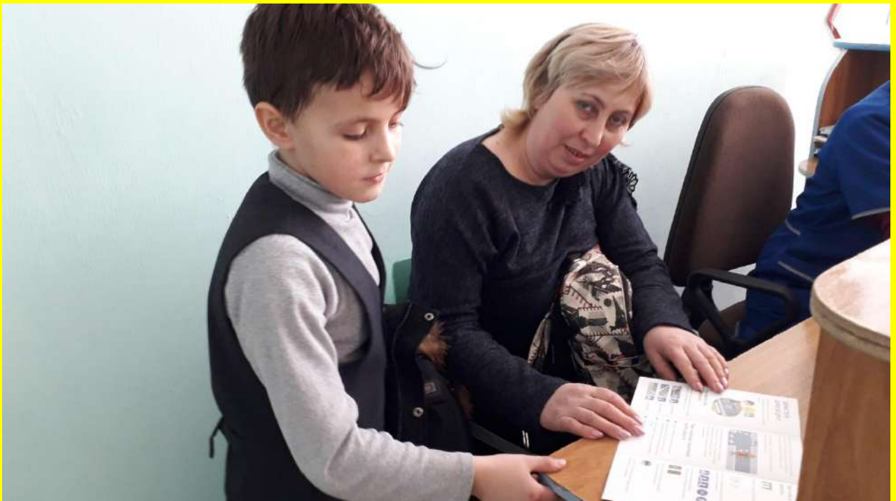
Фото 18. Работа с родителями по пропаганде правильной перевозки детей.