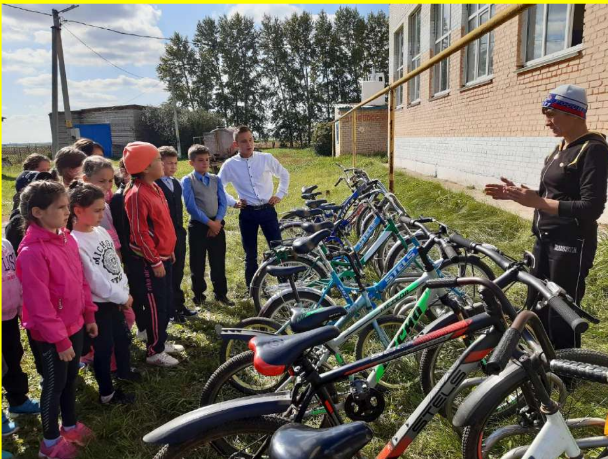
Фото 2. Организация занятий с велосипедистами.