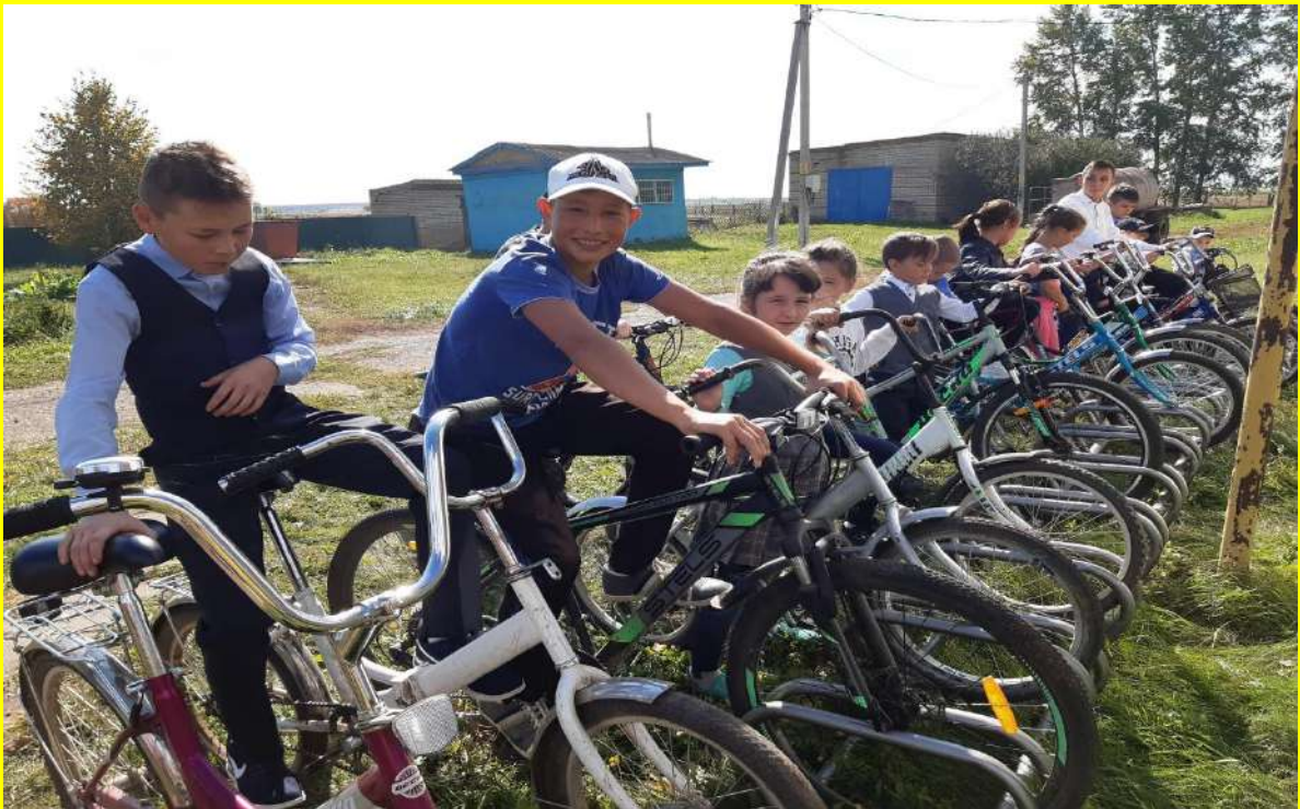
Фото 24. Профилактическая работа с юными велосипедистами.