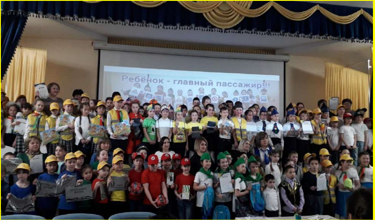
Фото 15. Выступление отряда «Глобус» на смотре-конкурсе ЮИД «Ребёнок – главный пассажир!».