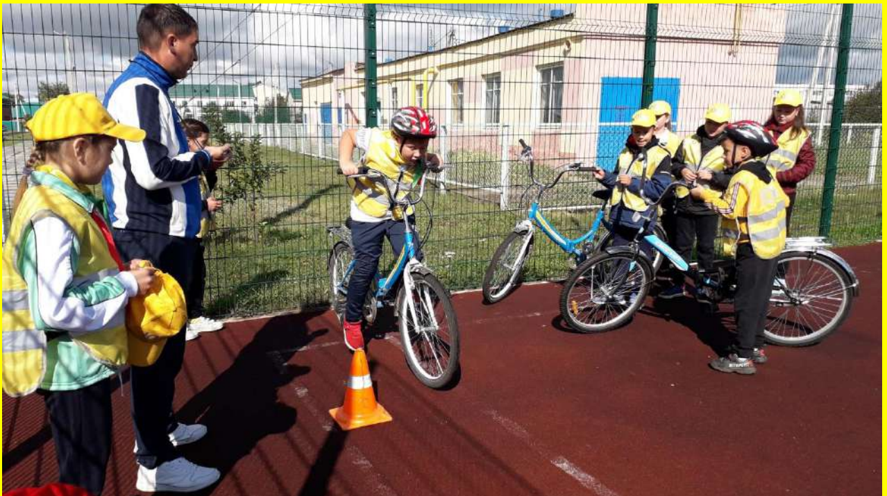
Фото 20. Оказание содействия в обучении юных велосипедистов правилам дорожного движения и навыкам управления велосипедом.