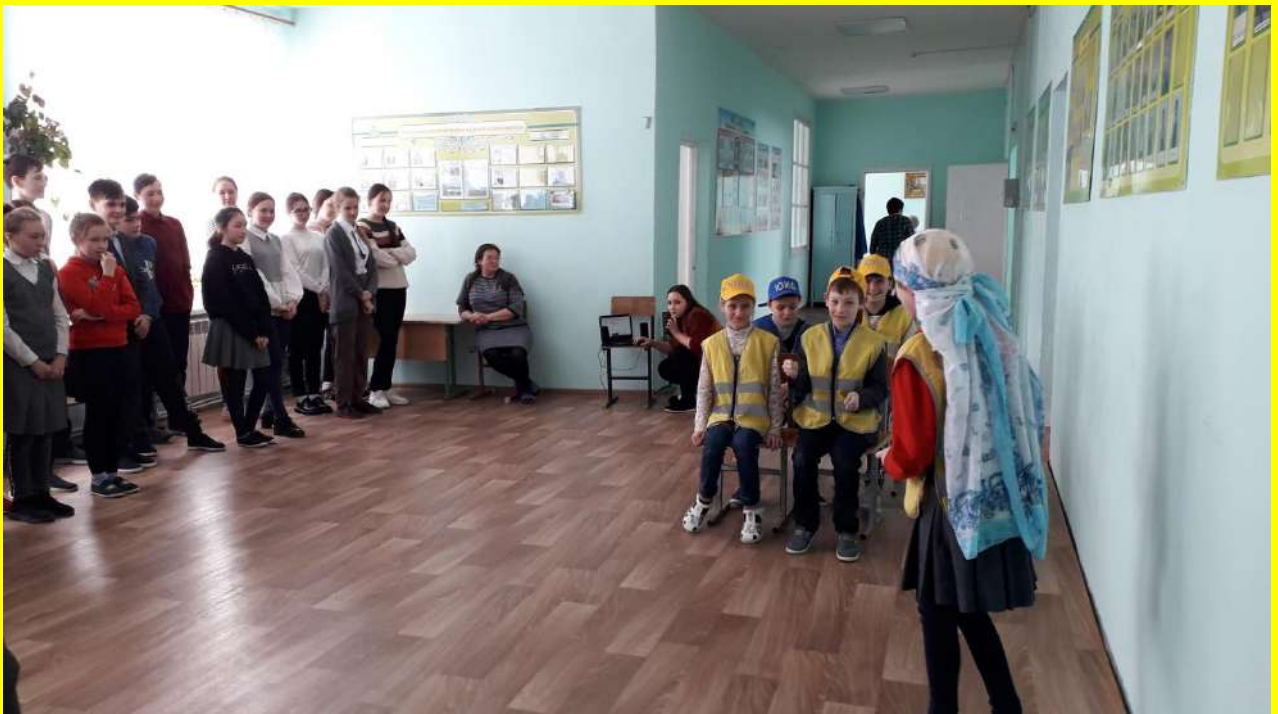
Фото 16. Выступление агитбригады перед школьниками на тему «Ребёнок – главный пассажир!».