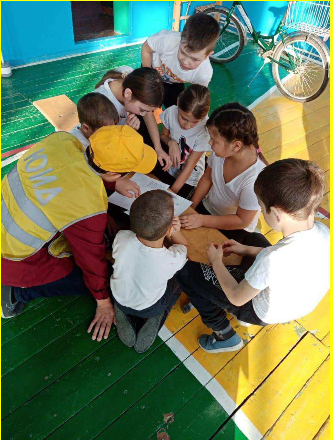
Фото 14. Проведение конкурса ЮИД среди начальных классов.