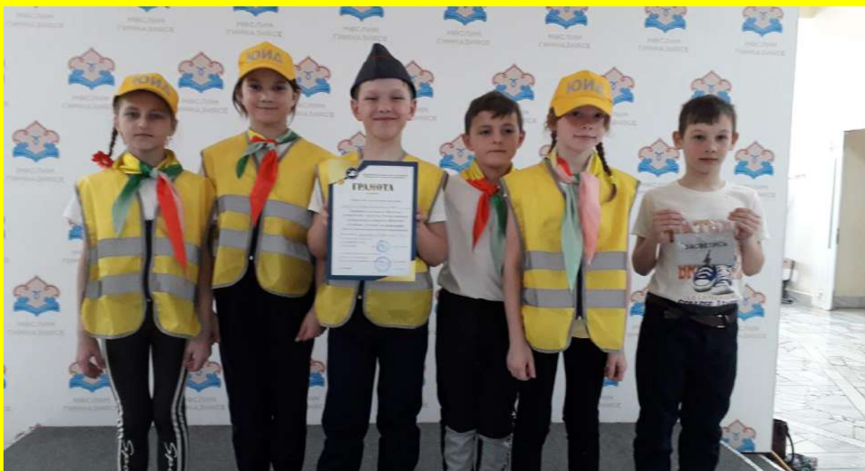
Фото 1. «Глобус» победитель в смотре-конкурсе по номинации «Проблемы безопасности – проблемы России».