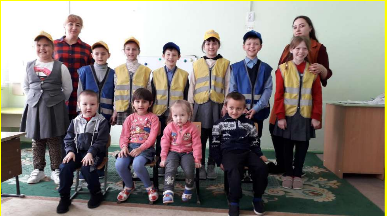
Фото 17. Работа в подшефных образовательных организациях с детьми.