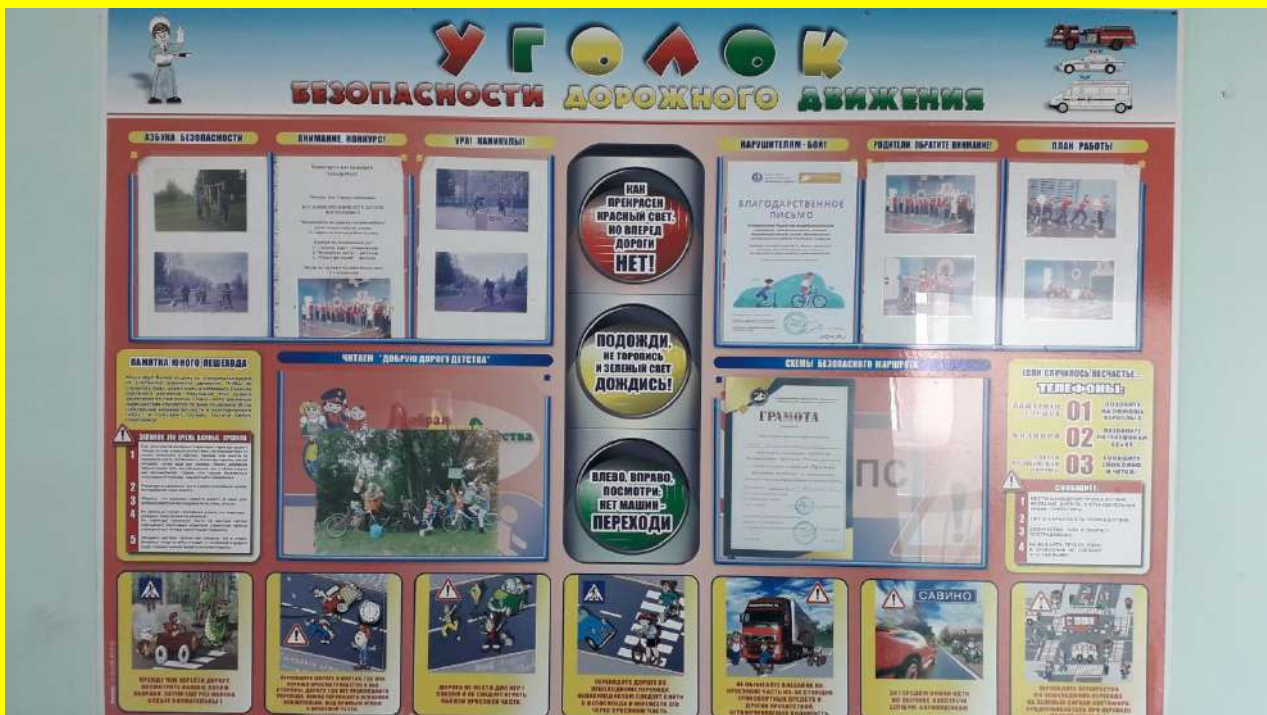
Фото 6. Создание стендов по ПДД.