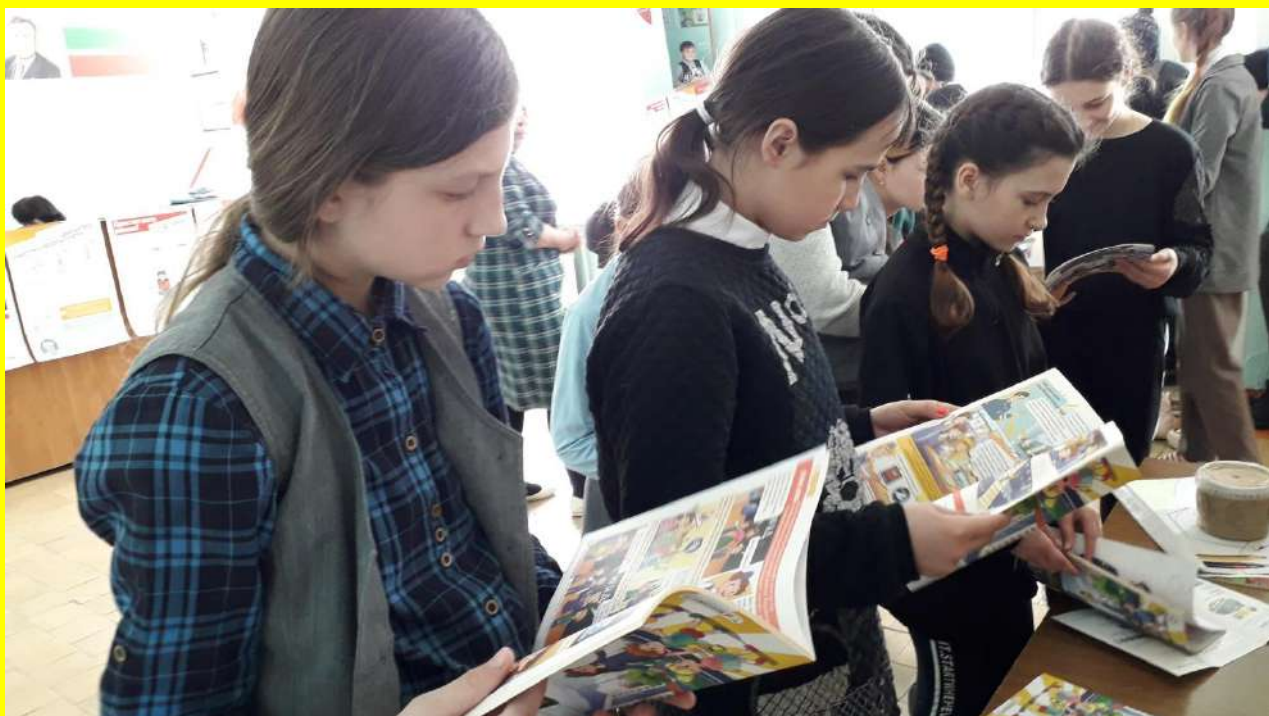
Фото 11. Организация массово-разъяснительной работы по пропаганде правил безопасного поведения на дорогах в школе.