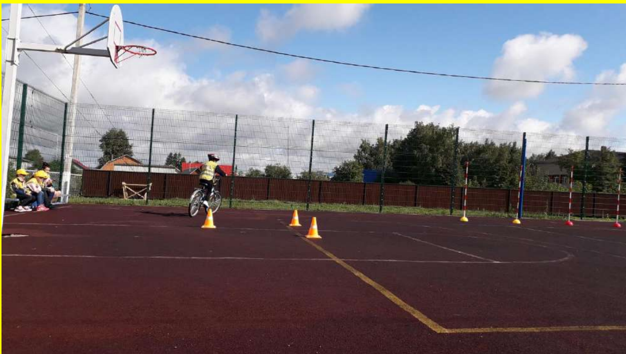
Фото 3. Обучение фигурному вождению.