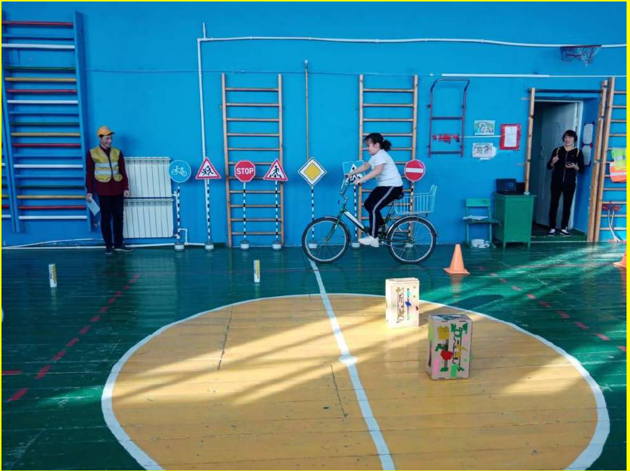
Фото 23. Организация практических мероприятий на территории школы с использованием мобильных знаков.