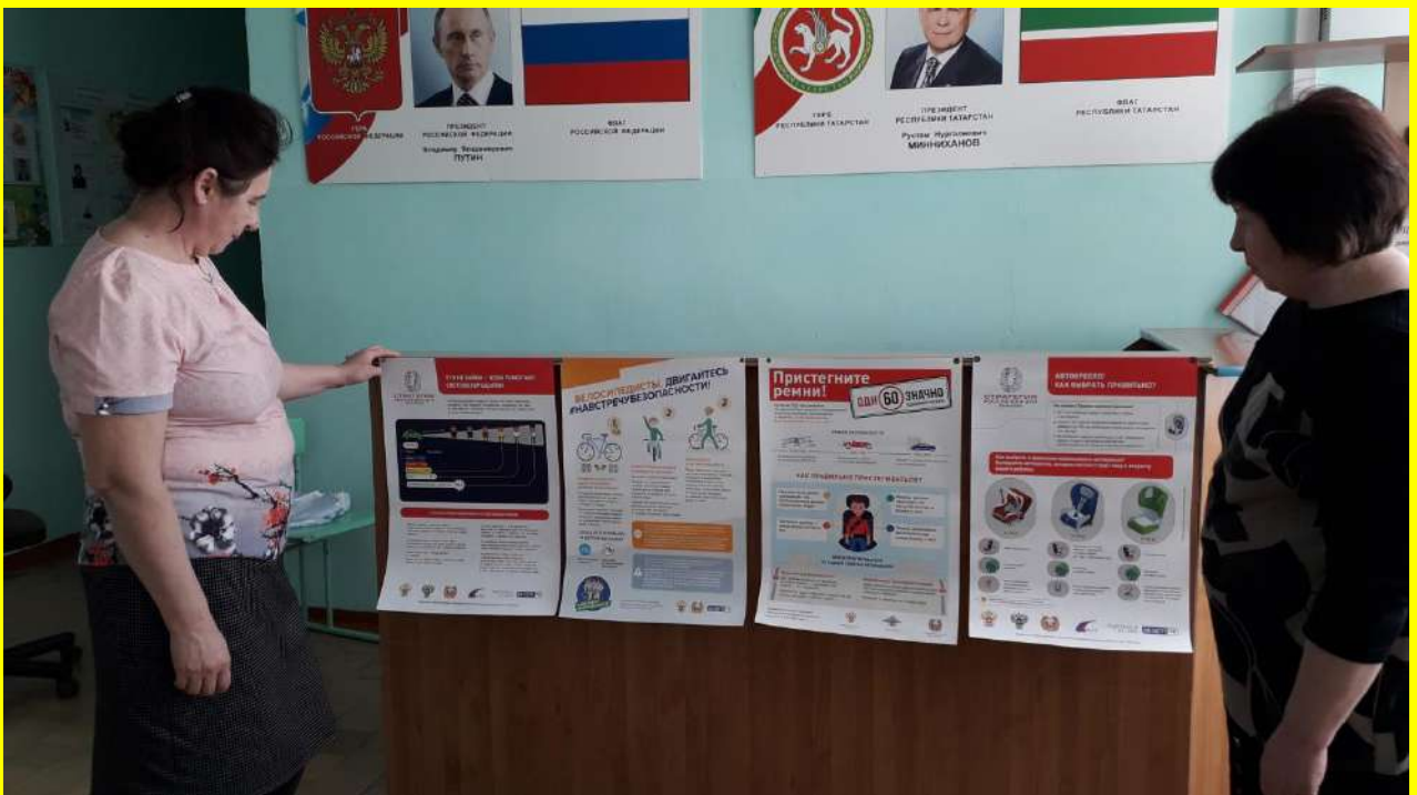
Фото 13. Пропагандистская работа среди родителей и педагогов. Беседа с родителями. Ознакомление родителей-водителей с нововведениями в правилах перевозки пассажиров-детей.