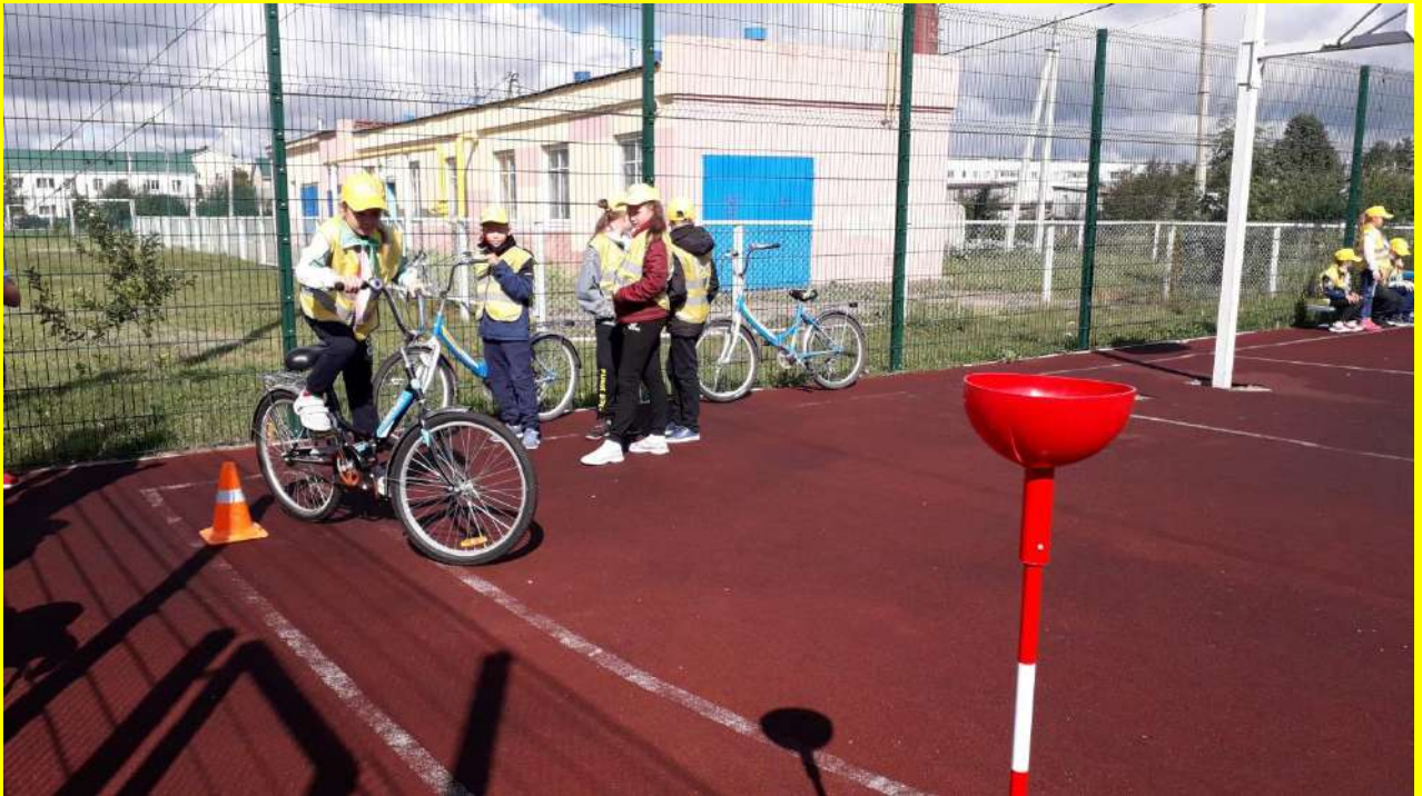
Фото 4. Подготовка к прохождению велотрассы с препятствиями.