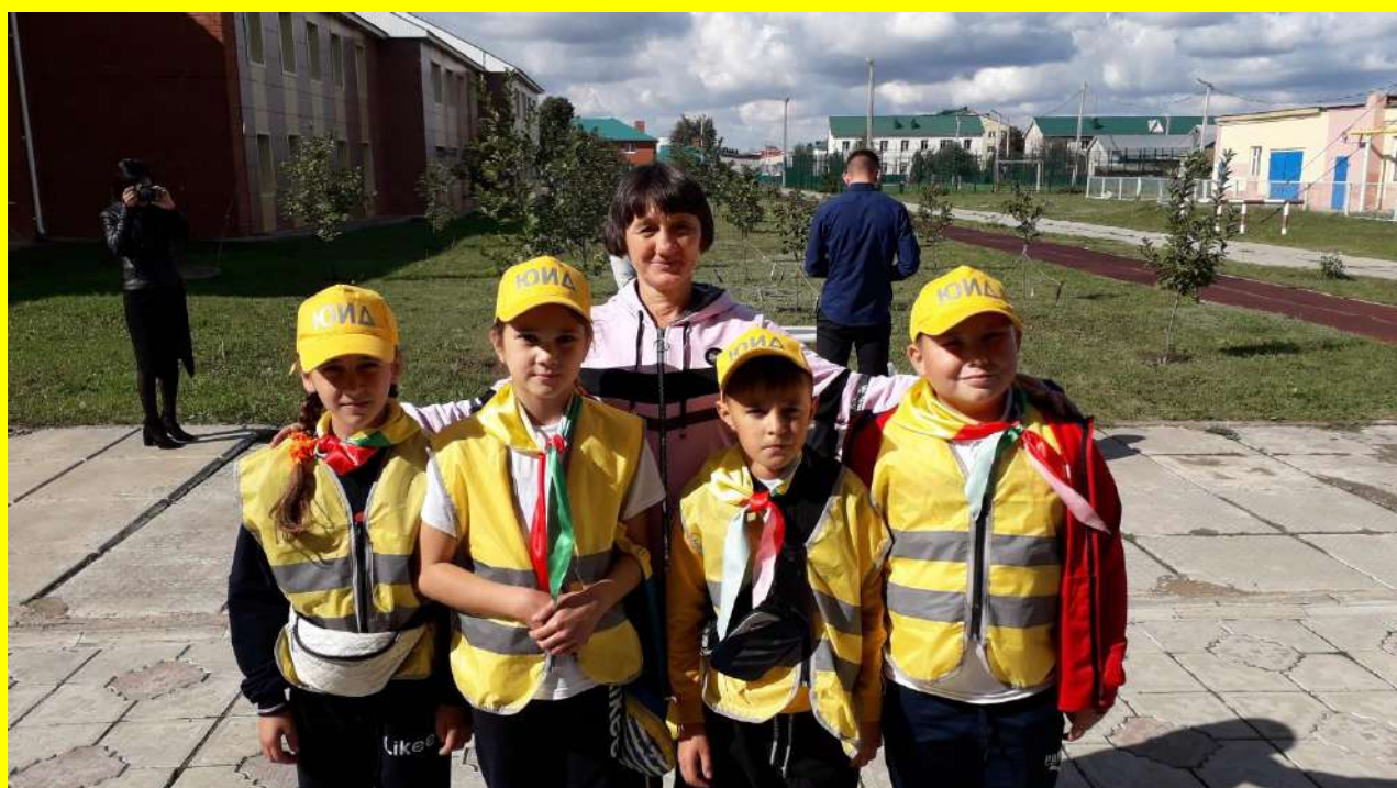
Деятельность отряда «ГЛОБУС»