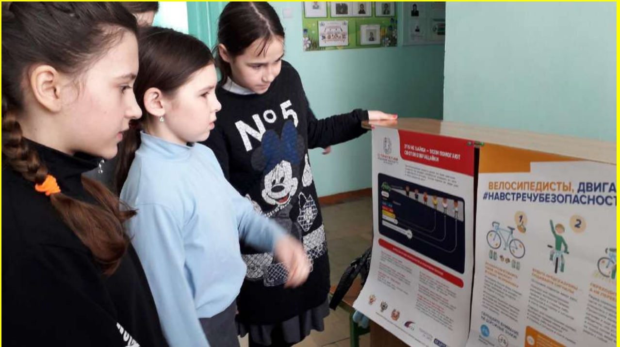
Фото 19. Проведение обучающих мероприятий среди учащихся старших классов.