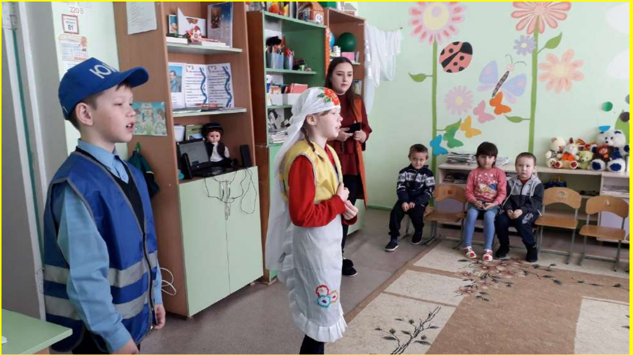
Фото 12. Организация массово-разъяснительной работы по пропаганде правил безопасного поведения на дорогах в группе дошкольного воспитания.